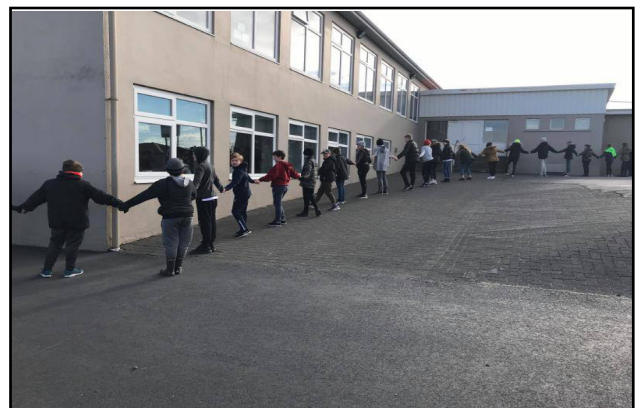
Hér sjáum við grunnskóla Hornafjarðar takast hönd í hönd sem tákni um samstöðu gegn kynþáttamísrétti.

Jafnframt skrifuðu ungmenni persónuleg póstkort sem send voru til handahófsvalinna Íslendinga líkt og verið hefur síðustu ár. Skilaboðin voru skrifuð sem hvatning til samstöðu gegn kynþáttafordómum og var viðtakendum boðið að taka þátt í þeirri samstöðu með því að taka mynd af sér með skilaboðunum undir millumerkinu #hondihond.