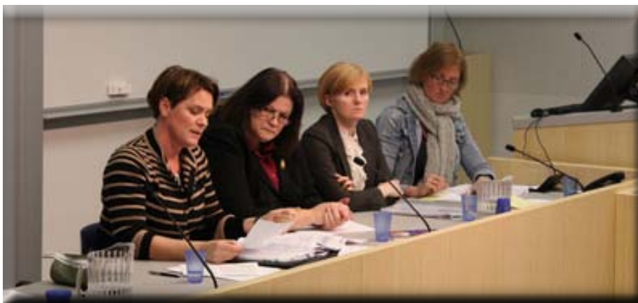
Lagadeild HR stóð fyrir málstofu um gerð nýrrar stjórnarskrár sem stjórnlagaráð lagði fyrir Alþingi á árinu. Aðalræðuefni fundarins var mannréttindakafliinn. Framkvæmdastjóri og stjórnarformaður Mannréttindaskrifstofu sátu í pallborði.

Flótta er skipt í þrjá hluta. Í fyrsta hluta setur leikmaðurinn sig í spor flóttamannsins með því að spila gagnvirkan