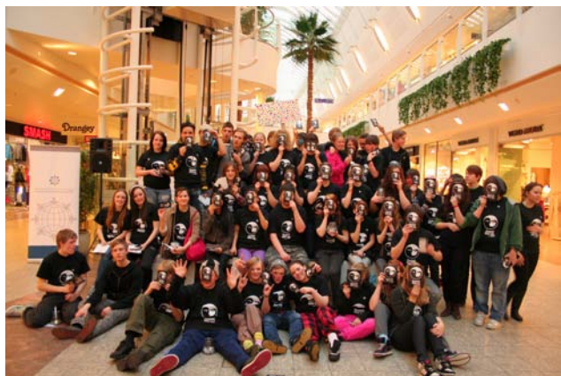
Aðalviðburður Evrópuvikkunnar var í Smáralind en þar söfnuðust ungmenni saman og dreifðu bæklingum með upplýsingum um kynþáttamisrétti.